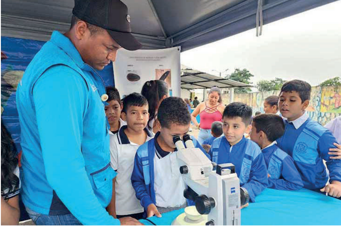
NOVEDAD. A los alumnos les llamó la atención mirar por el microscopio.