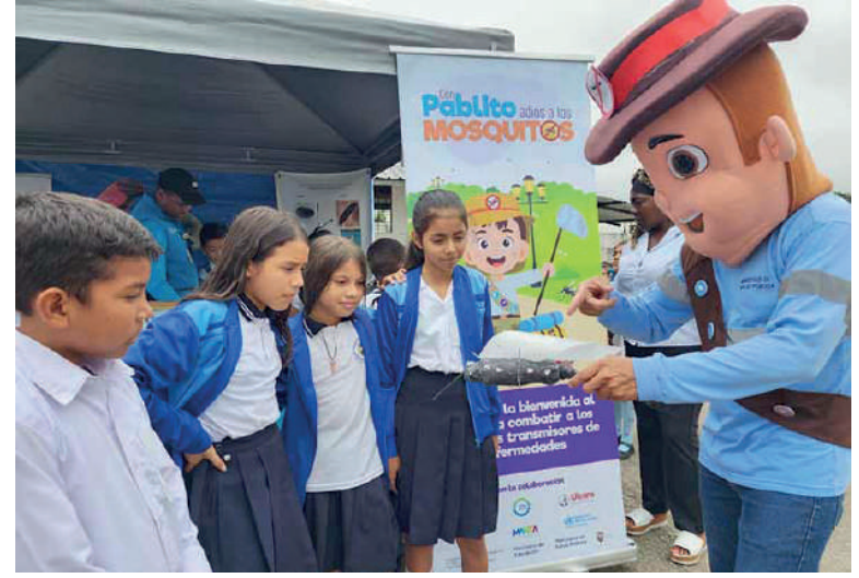
DIVERSIÓN. Con juegos lúdicos los estudiantes aprenden.

Según manifestó Francisco Ayala, director distrital de Salud, hasta la semana epidemiológica 26, los casos confirmados de dengue son de 1.038 , de los cuales 56 son con signos de alarma y cuatro graves. "La mayor parte de los pacientes son menores de edad", dijo el funcionario, asegurando que la alerta