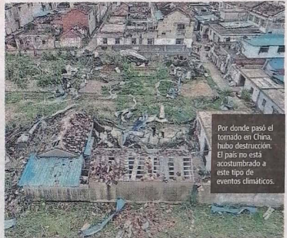
Por donde pasó el tornado en China, hubo destrucción. El país no está acostumbrado a este tipo de eventos climáticos.

China ha visto un récord de lluvias y semanas de calor sofocantes en este verano boreal. Según los científicos, estos fenómenos climáticos extremos se han visto exacerbados por el calentamiento global.