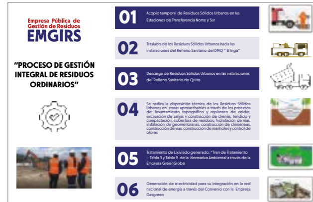
Tabla 2: Proceso de Disposición de Residuos Ordinarios

Se estima que la vida útil del Relleno Sanitario de Quito culmine a mediados del año 2025 por lo que actualmente se están ejecutando acciones para la implementación de un nuevo complejo ambiental.