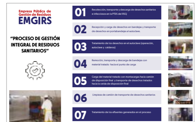
Tabla 3: Proceso de Disposición de Residuos Sólidos Sanitarios

El proceso de disposición final de Residuos Sanitarios en el DMQ contempla el proceso descrito a continuación: