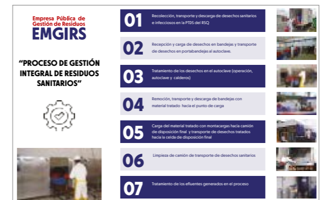
Tabla 3: Proceso de Disposición de Residuos Sólidos Sanitarios

El proceso de disposición final de Residuos Sanitarios en el DMQ contempla el proceso descrito a continuación: