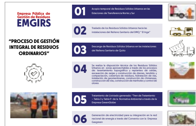
Tabla 2: Proceso de Disposición de Residuos Ordinarios

Se estima que la vida útil del Relleno Sanitario de Quito culmine a mediados del año 2025 por lo que actualmente se están ejecutando acciones para la implementación de un nuevo complejo ambiental.