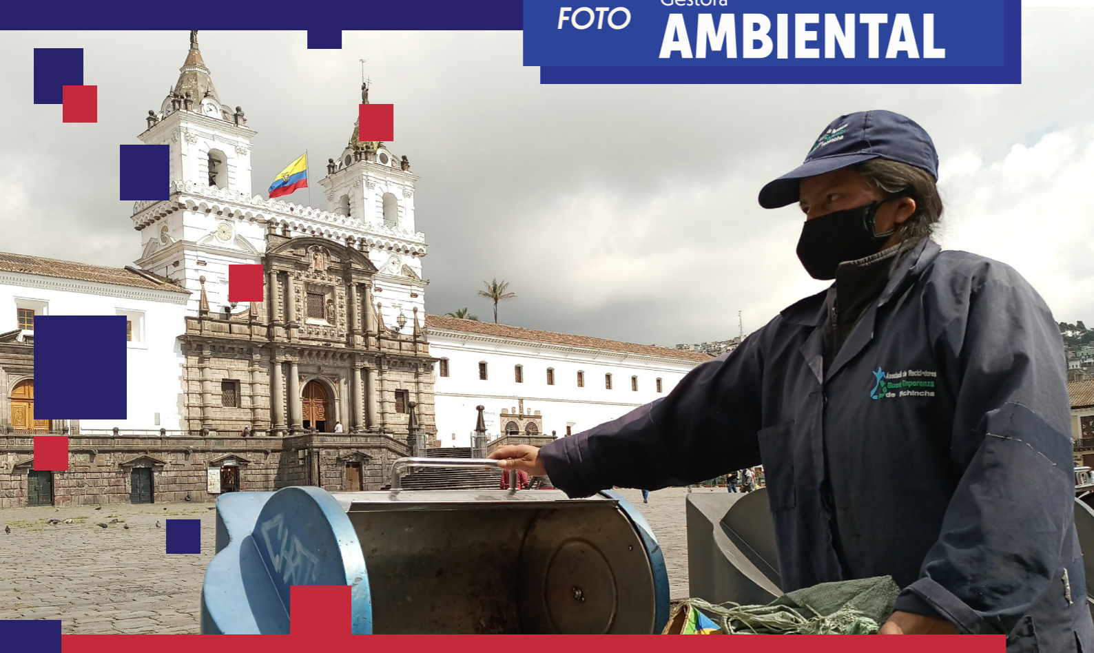
FOTO Gestora AMBIENTAL

Fuente & Elaboración: Unidad de Comercialización de la EMGIRS EP