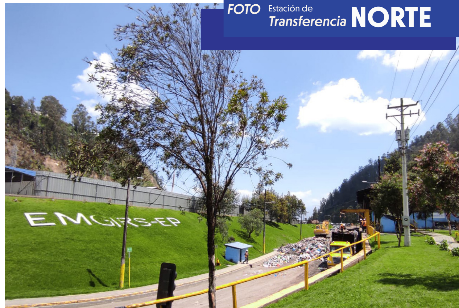
FOTO Estación de Transferencia NORTE

Las demás actividades operativas y de prestación de servicios relativas a las competencias que le corresponden al Municipio del Distrito Metropolitano de Quito, de conformidad con el ordenamiento jurídico nacional y metropolitano, en el ámbito del manejo integral de los residuos sólidos del Distrito Metropolitano de Quito.