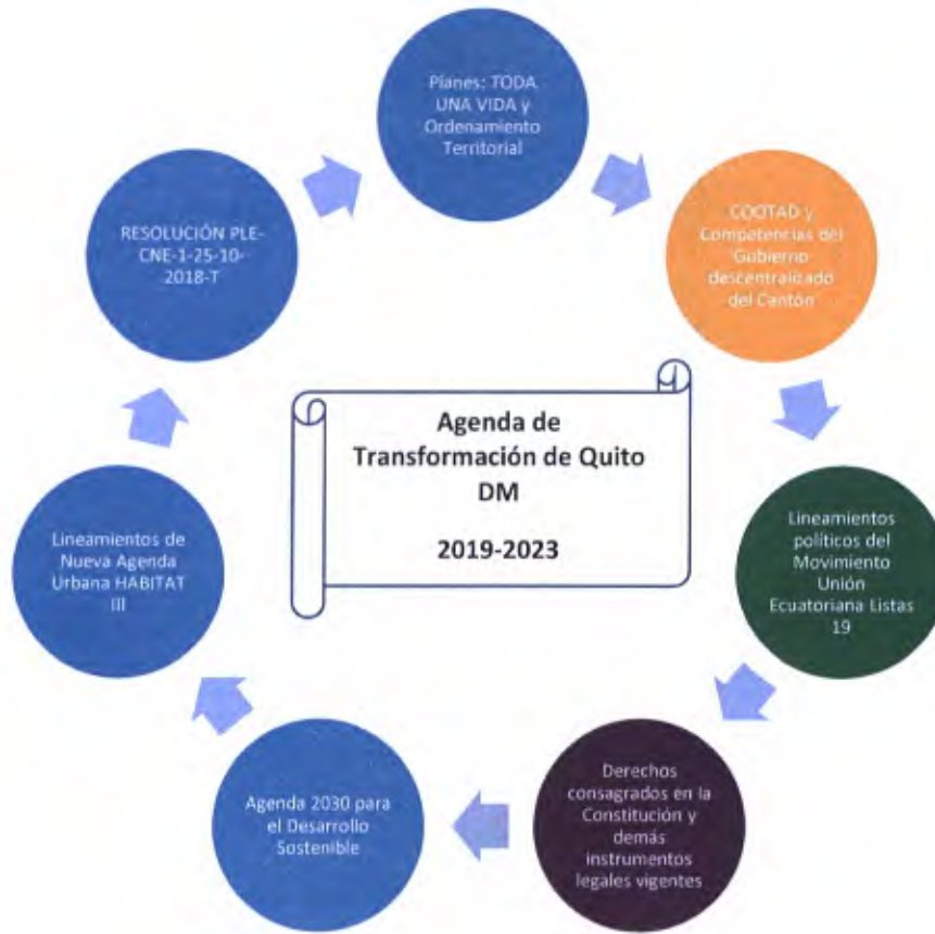
Ilustración 1. Componentes referenciales del plan de trabajo

Fuente: Instituto de la Democracia Elaboración: Pubenza María Fuentes Flores