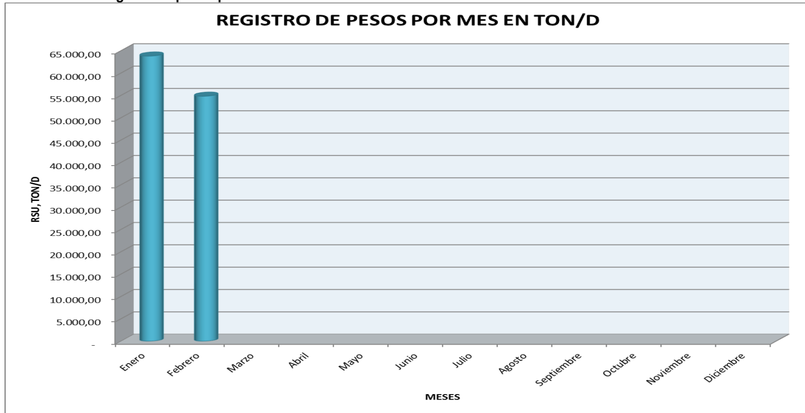
Gráfico 1: Registro de pesos por mes