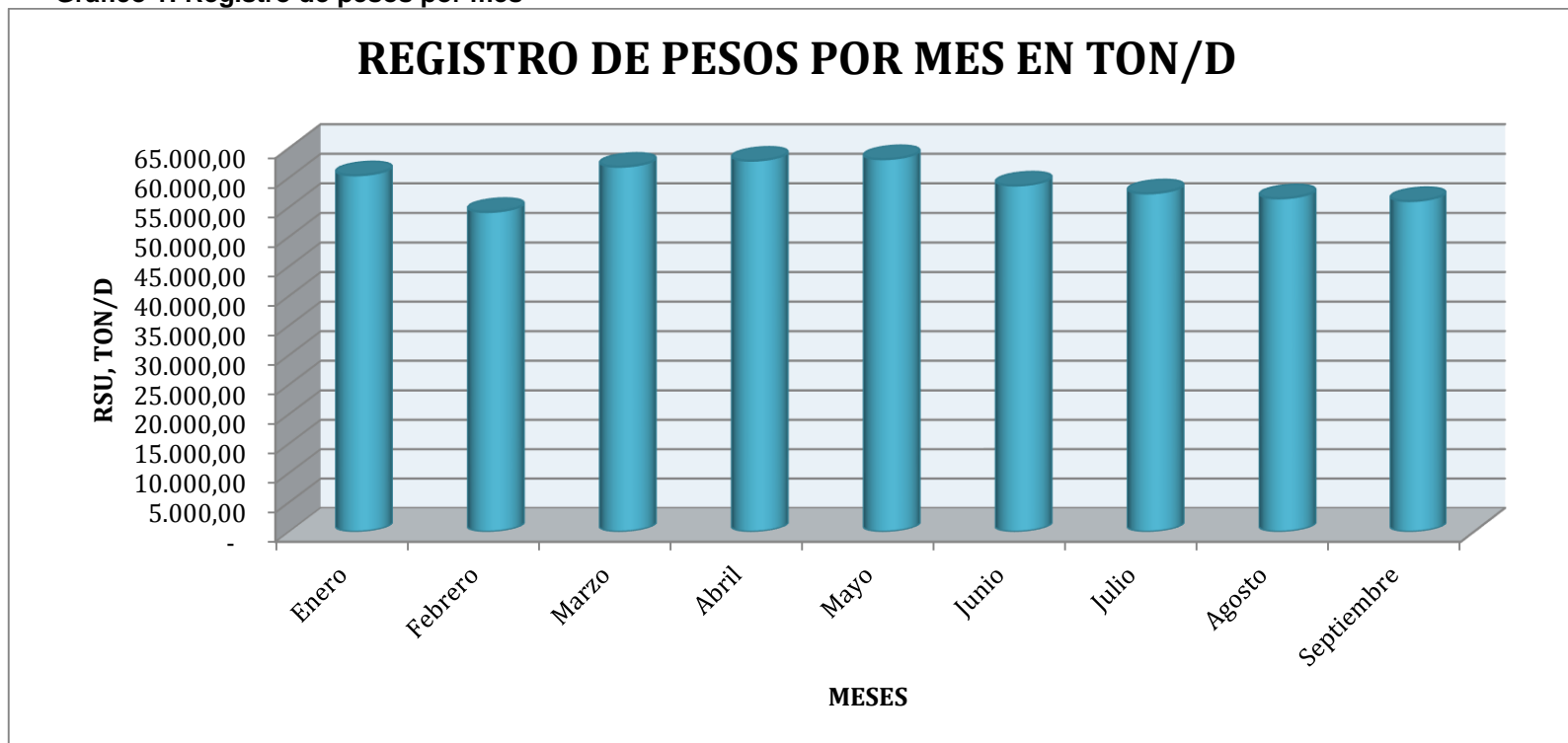
Grafico 1: Registro de pesos por mes