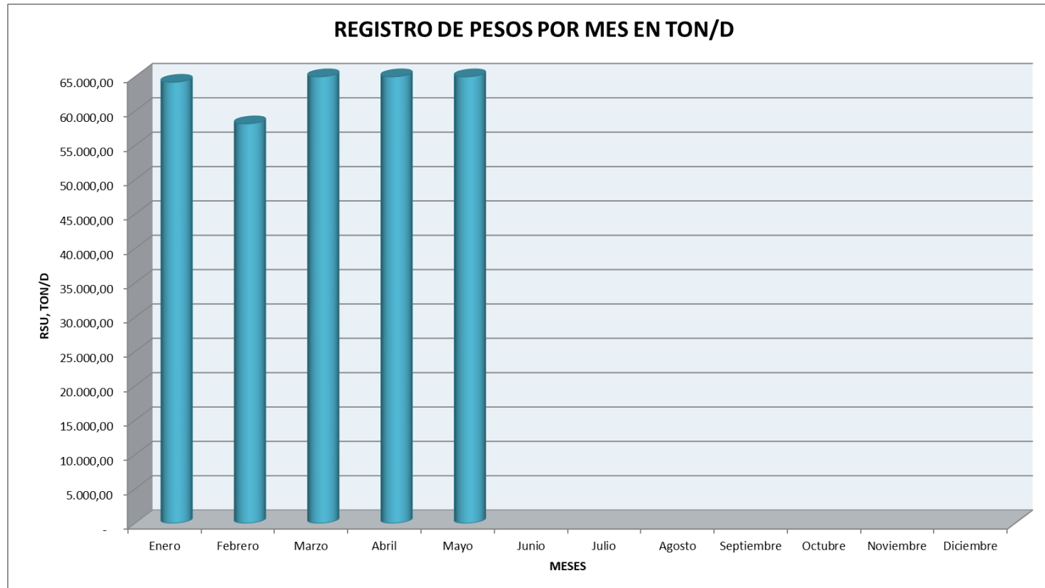
Gráfico 1: Registro de pesos por mes