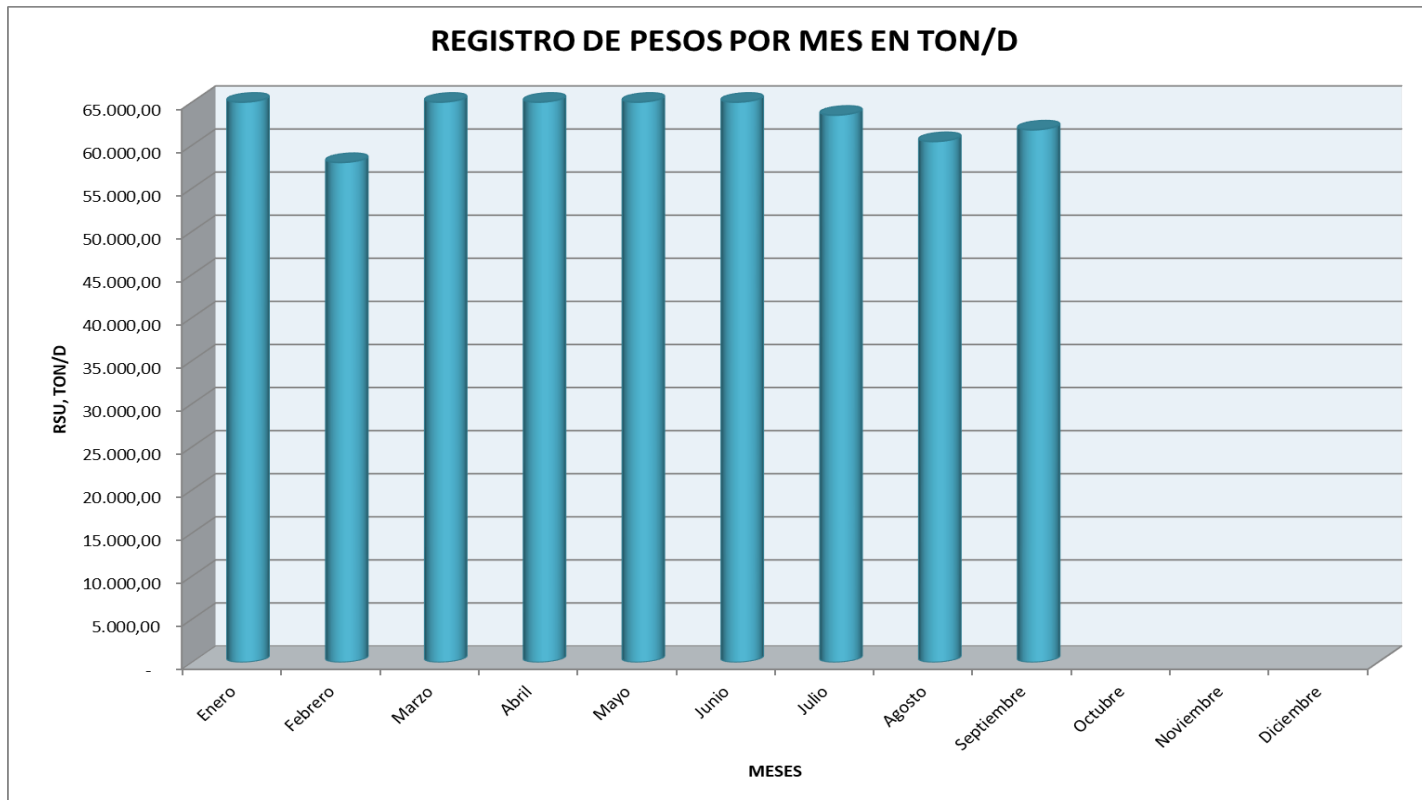
Grafico 1: Registro de pesos por mes