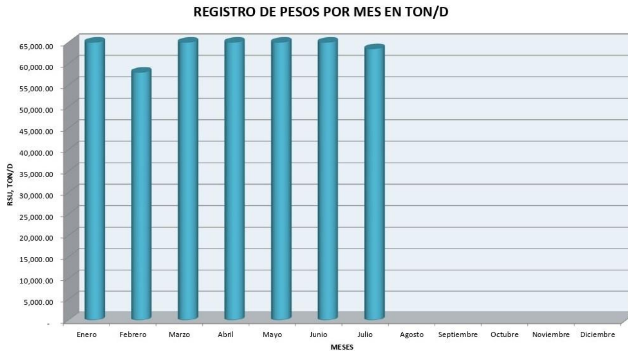
Grafico 1: Registro de pesos por mes