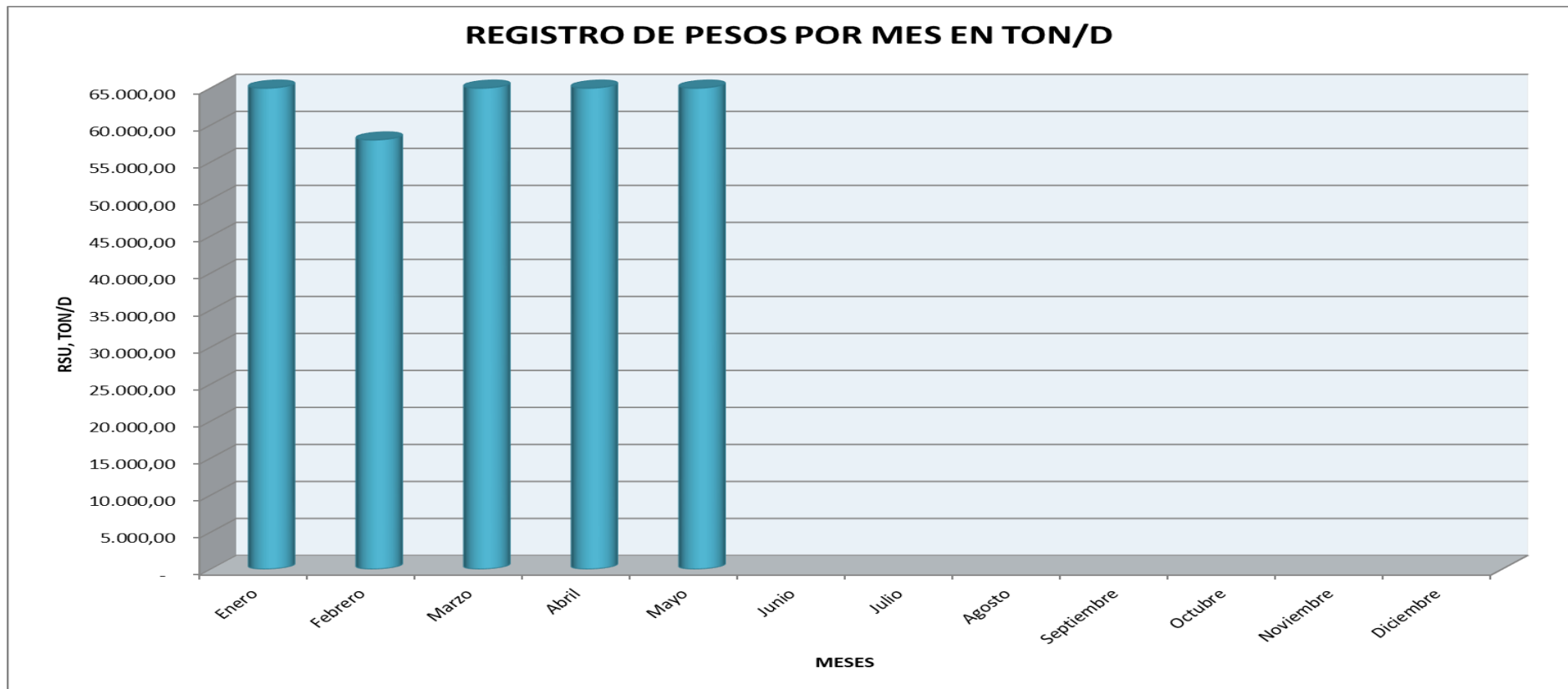
Grafico 1: Registro de pesos por mes