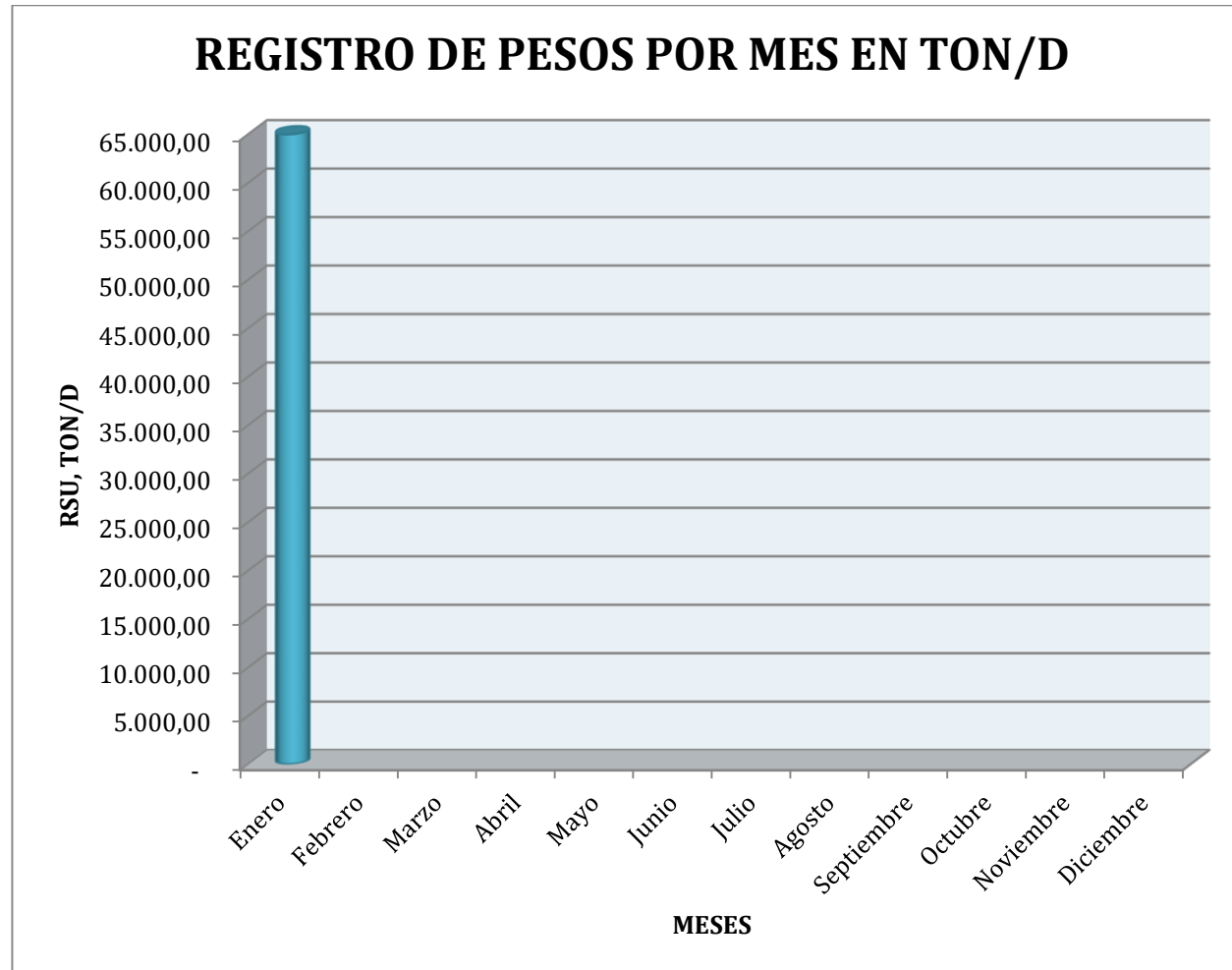
Grafico 1: Registro de pesos por mes