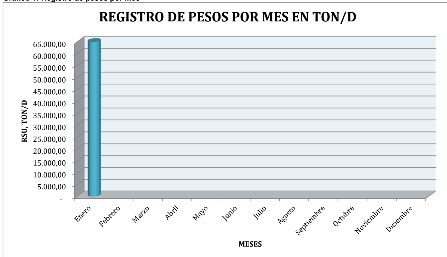
Grafico 1: Registro de pesos por mes